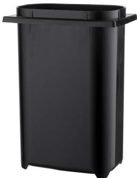
Kantin i plast