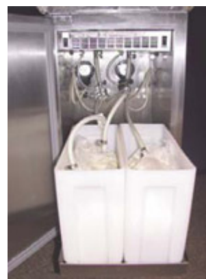
Kylutrymme med utdragbar hylla

- Möjligt att beställa bag in box anslutningskit. Alltid färsk mix med BagInBox