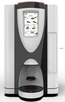
LEI SA RY TOUCH 7" FV