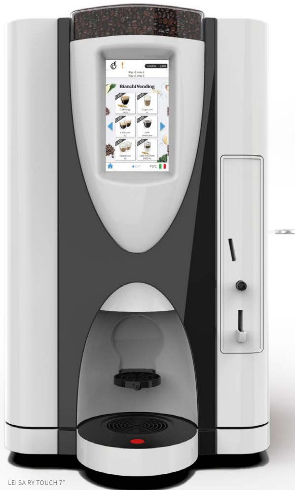
LEI SA RY TOUCH 7"

LEI SA RY, en semi-automatisk OCS (Office Coffee Service) maskin som erbjuder kaffe i alla sina olika smaker.