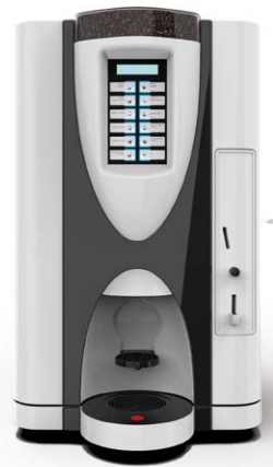
LEI SA RY EASY