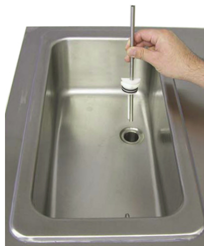
Mixbehållare med mix- och luftinblandningsrör